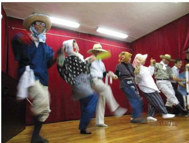
各施設で大人気の『踊る新田チーム』！！そのパフォーマンスは必見です！

・お馴染み「踊る新田チーム」による小規模多機能居宅介護施設等への訪問交流。 ・新田の家の植栽活動。夏野菜等の植え付け、収穫、花苗、球根植え。