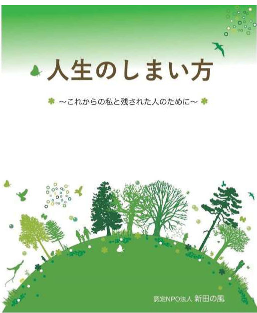
平成28年度 地域発元気づくり支援金活用事業

今回、私たちがたどり着いた完成品は、バインダーファイルに(タテ31mm×ヨコ27mm)、A4サイズのクリアポケットを綴じ込み、その中に、あなたにとって本当に大切な事柄を書き込めるページを挟み込んだ物になりました。書きたい箇所から自由に記入し、足りないと感じになるページには自分でページを増やしていただくこともできます。また一緒に閉じておきたい資料を入れておくこともできます。お手にとっていただいた方の思いに添って、「自身の人生を描いていただければと思います。タイトルは『人生のしまい方』です。2月中旬より、新田の風事務所を中心に1冊500円で販売いたします。